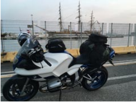
Warten auf die Fähre