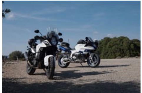
Und die ersten Meter auf der Insel