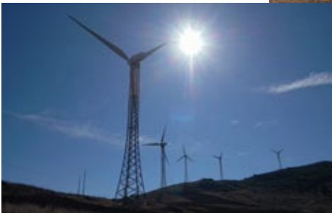
und Wind gibt's hier oben reichlich