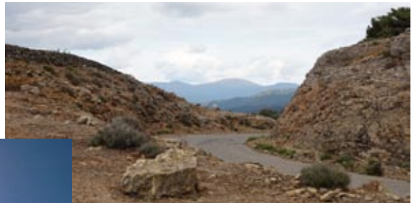
Einsame karge Gegend