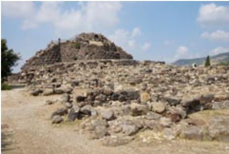
Der Nuraghe ist beeindruckend - aber es war einfach zu heiß für eine Besichtigung.