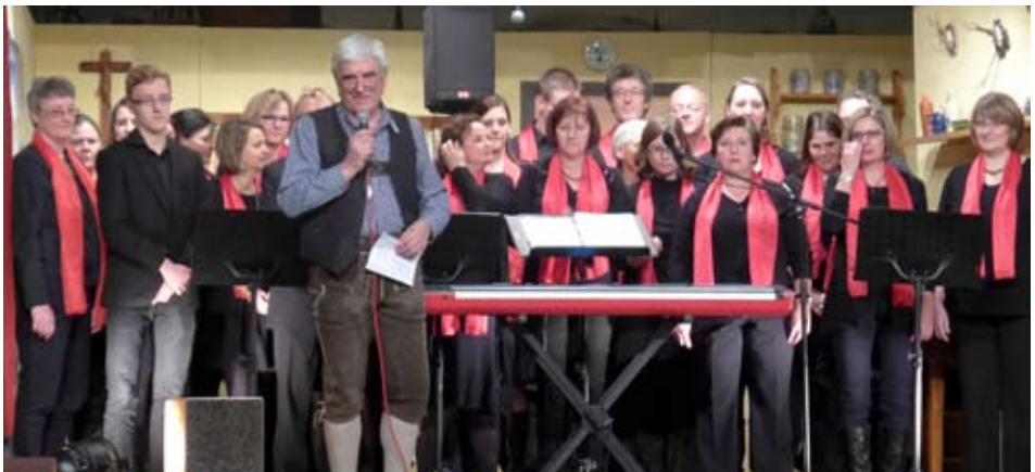
07. Dezember: 42. Auflage der ACM Nikolausfeier im Augustinerkeller mit Chorgesang, Theaterstück, bayerischer Stubenmusi und dem Nikolaus samt Krampus und Engerln.