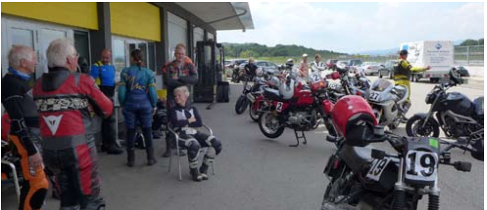
12. Juli: Clubpokal auf dem nahe gelegenen Wachau-Ring bei Melk. Rechte Seite: Supermoto-Training in Memmingen am 10. September.