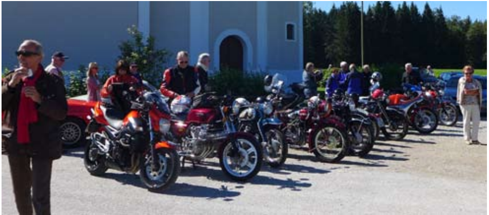
17. August: ACM Oldtimer Ausfahrt von Unterhaching Richtung Starnberger See ins Land von „Hubert und Staller“ mit abschließender Besichtigung einer denkmalgeschützten Getreidemühle in Krailling.