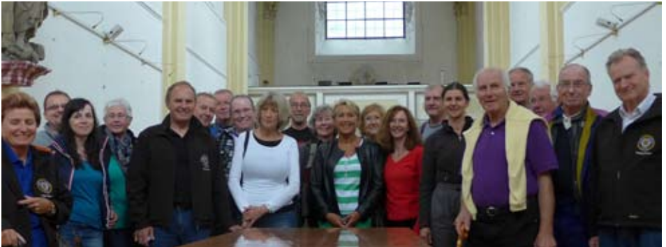
11. Juli: Clubausfahrt mit Start und Ziel in Emmersdorf/ Wachau.