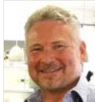
Öffentlichkeit u. Presse Andreas Kropatschek