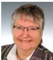
Präsidentin Ulrike Feicht