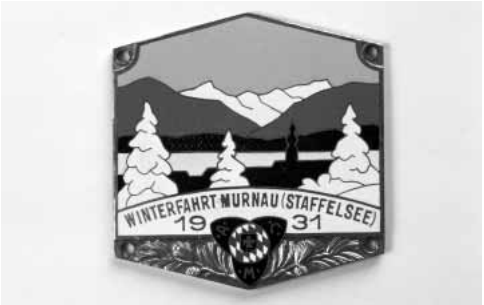
ACM Winterfahrt Murnau (Staffelsee) 1931