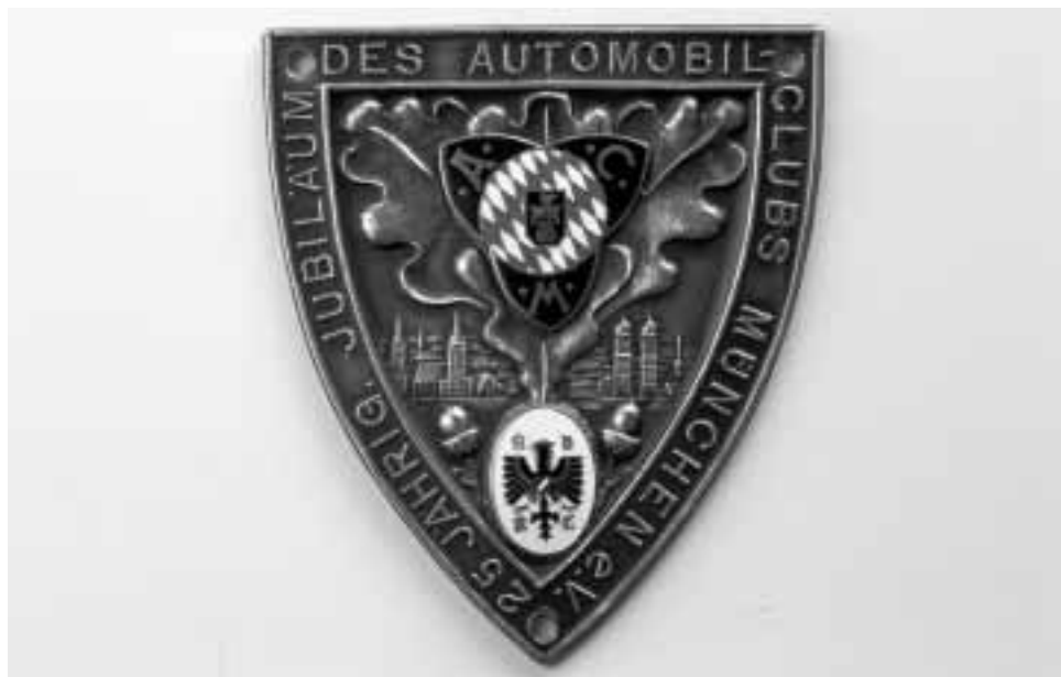
25 jähriges Jubiläum des Automobil-Clubs München e.V.