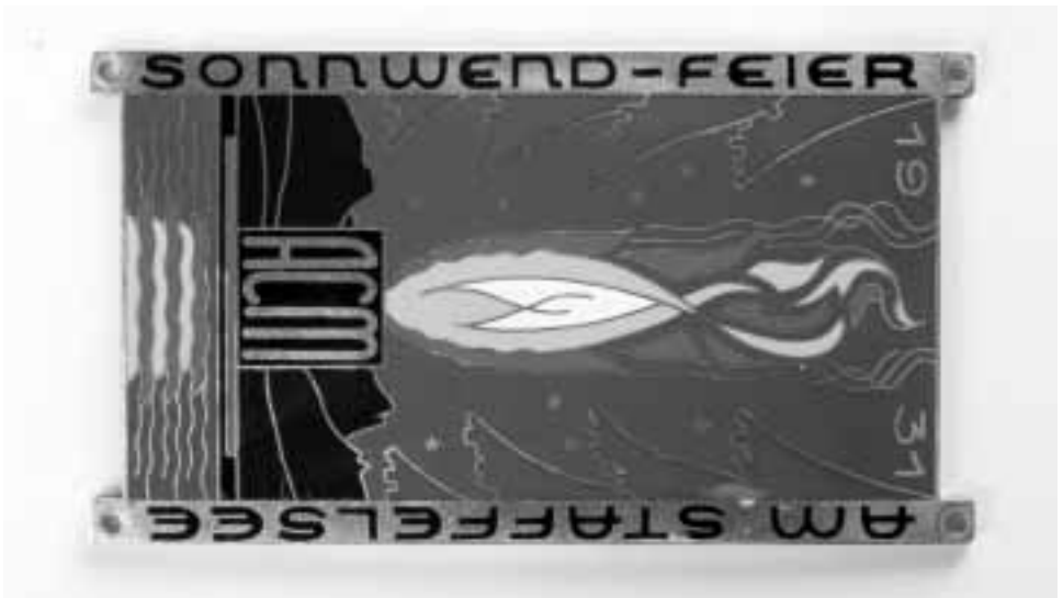
ACM Sonnwendfeier am Staffelsee 1931