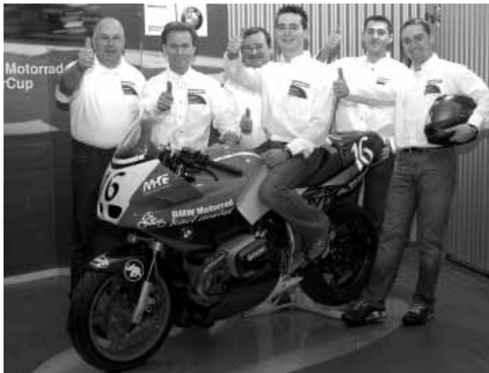
Karl Maier Racing Team