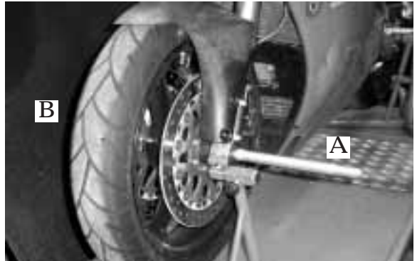
Montagedorn einmal mit montierter Achse

Zuerst wird die Mutter auf der linken Seite der Achse abgeschraubt, dann wird Teil „A“ von der rechten Seite in die hohlgebohrte Achse bis zum Anschlag geschoben. Danach wird Teil „B“ von links in die Achse eingeführt und mit Teil „A“ verschraubt. Anschliessend die Klemmschrauben an der Gabel lösen, Bremssättel abnehmen und Teil „B“ an der Zentrierfläche leicht einfetten (z.B. Kettenfett). Jetzt die Achse mit einem Kunststoffhammer heraustreiben bis Teil „B“ fast vollständig in der