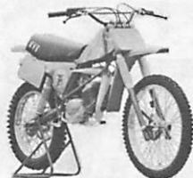
Van Veen MC-S-50 6 Gang · 14 PS