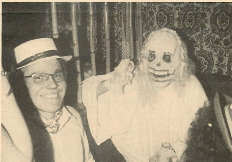
In Ismaning kam sogar der Tod zur Faschingsgaudi